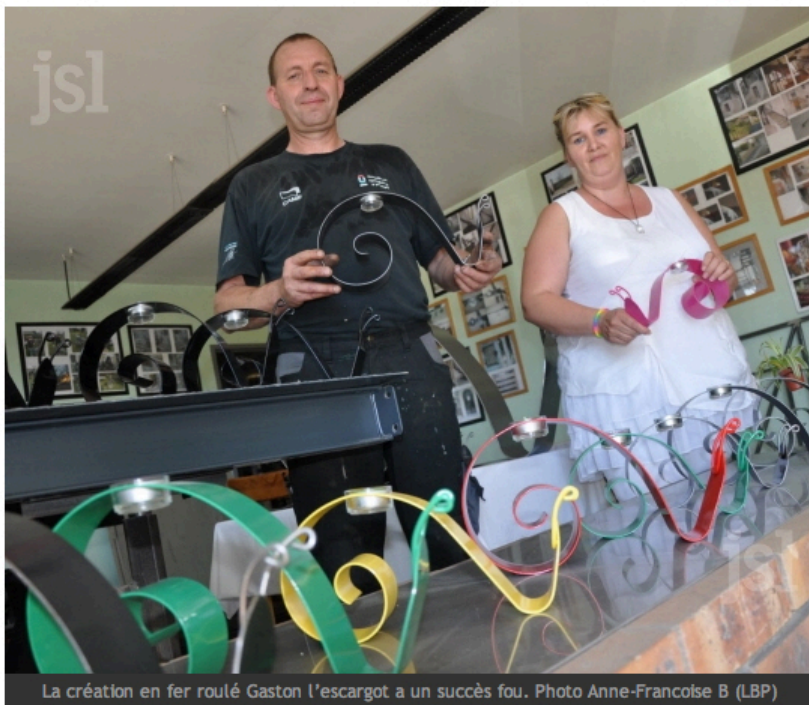
La création en fer roulé Gaston l'escargot a un succès fou.

le 31/07/2014 à 07:00 | Anne-Françoise BAILLY Vu 924 fois